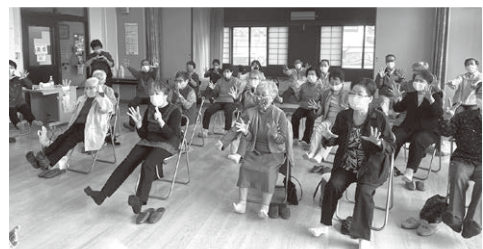
いきいきサロン山波