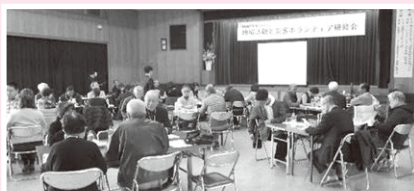
災害ボランティア研修会の様子

訪問した世帯数 合計 383世帯 旧尾道：132 因島：161 御調：25 瀬戸田：10 向島：42 市外転居等：13 (令和2年12月末現在)