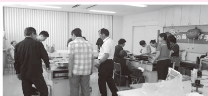
御調 茶話会の様子