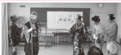
尾道 茶話会の様子

尾道市支え合いセンターは、平成30年7月豪雨被災者の寄り添い支援を目的として開所しました。被災者宅へ訪問し、被災による困りごとを聞いたり、防災に関する情報提供を行いました。その他にも、災害ボランティアの派遣や、もともとある生活上の困りごとの解決に向けて支援機関への橋渡しを行ってきました。訪問支援以外にも、各種相談会や茶話会、防災関連のイベント等も開催しました。豪雨災害から2年半が経ち、現在では、多くの世帯が少しずつ元の生活に戻ってきています。