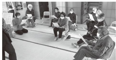
いきいきサロンひまわり

再開したサロンでは、感染対策をとりながら、地域のみなさんの笑顔と元気があふれています。