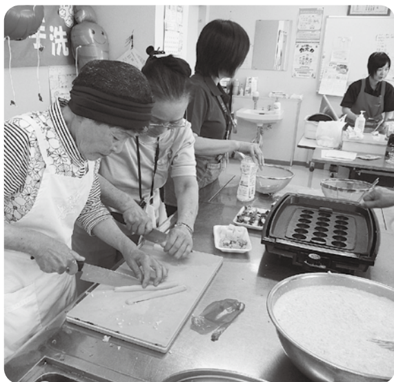
↑御調茶話会でたこ焼きを作りました

昨年の西日本豪雨災害 被災から1年が経ちました。 被災からの復旧・復興が 進んでいる所もありますが、 今も被災後から変わらな ず 支援を必要とされている 方も多くいらっしゃいます。 尾道市支え合いセンター では、今も支援を必要とさ れている方お一人おひとり に寄り添いながら支援して います。