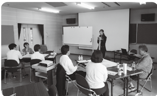
→災害ボランティア交流会の様子

最近では茶話会を開催し 被災者同士での交流や今 後の防災・減災について話し 合うなどの取り組みをして います。 今後もし引き続き、豪雨 災害が原因での不安やお困 り事がある方は、遠慮なく ご連絡ください。