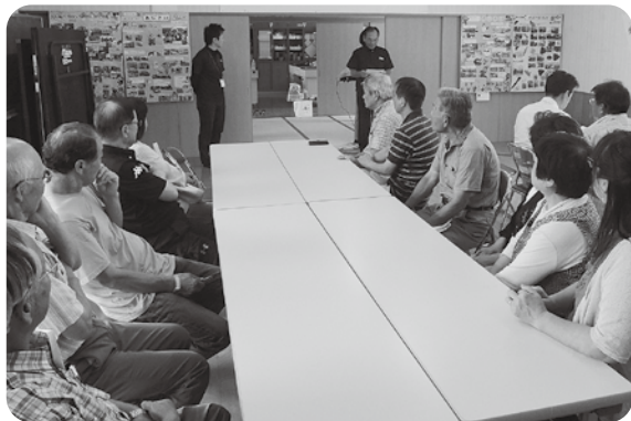
↑因島(中庄)茶話会の様子